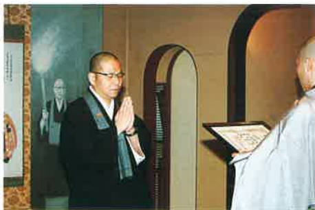
頂相の作者胡建明師