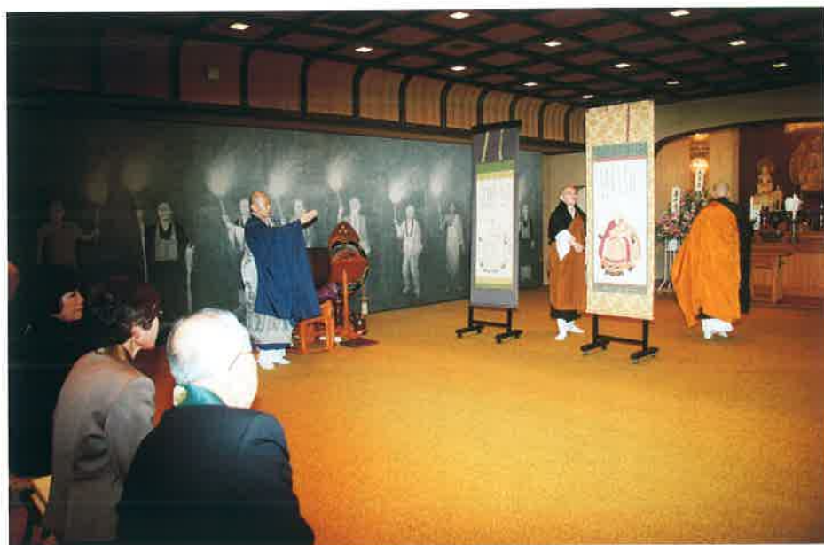
頂相の説明をする博志住職