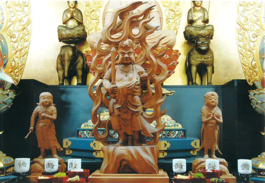
不動三尊像（向かって左より、制多迦童子 せいとがどうし 、身代り不動明王、矜羯羅童子 こんがらどうし ）