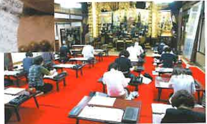
写経会 (毎月 第4金曜日 午後2時～)