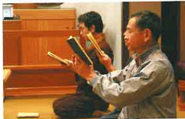
参禅会 (毎月 第1日曜日 午前6時～) (毎月 第3日曜日 午後2時～)