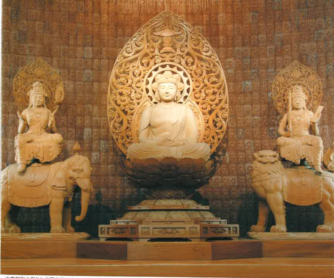
本尊釈迦牟尼仏と普賢菩薩(左)・文殊菩薩(右)