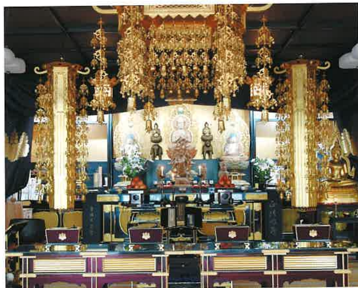
大日如来、薬師如来、阿弥陀如来と不動三尊