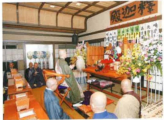
孟蘭盆施食法会 (6日)