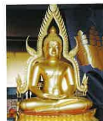
プラブッタチナラト