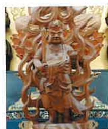
身代わり不動明王