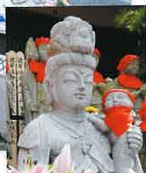
ほほえみ子安観音